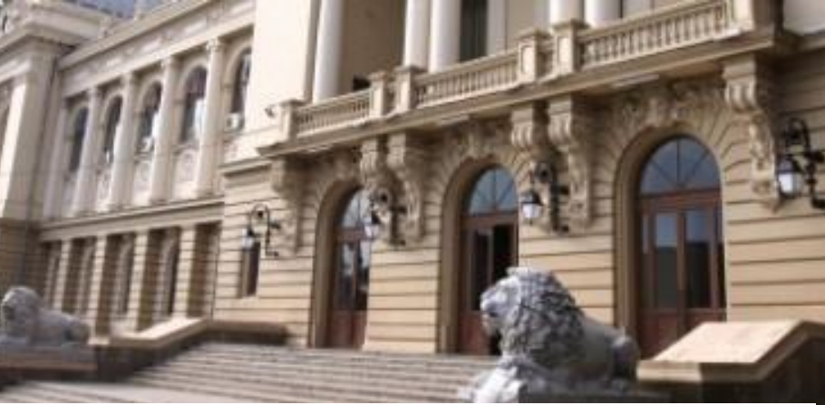
Universitatea « Alexandru Ioan Cuza » din Iași, România