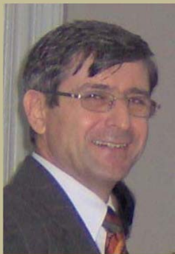
Prof. univ. dr. E-mail: gabidr@uaic.ro